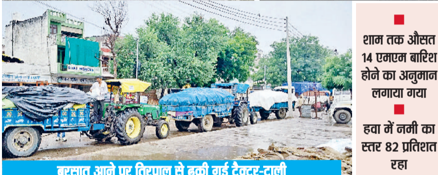
बरसात आने पर तिरपाल से ढकी गई ट्रैक्टर-दाली

■ शाम तक औसत 14 एमएम बारिश होने का अनुमान लगाया गया ■ हवा में नमी का स्तर 82 प्रतिशत रहा