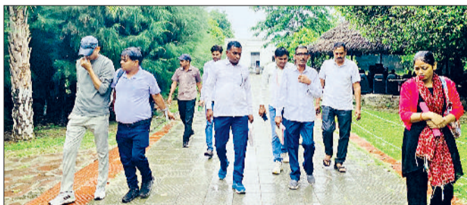
रेवाड़ी। घरों में जांच के लिए पहुंची स्वास्थ्य विभाग की टीम।

जिले में इस वर्ष डेंगू के आंकड़ों ने अगस्त माह से ही काफी रफ्तार पकड़ी हुई है। सीजन में अब तक 243 डेंगू पॉजिटिव मरीज मिल चुके हैं। इसके अलावा गत दिनों में 14 लोग मलेरिया की चपेट में भी आ चुके हैं। इस बार प्राइवेट लैबों से डेंगू की पुष्टि ज्यादा हुई है। अब तक 46 डेंगू मरीजों की सरकारी व 197 मरीजों की पुष्टि प्राइवेट लैबों से की गई है। अक्टूबर माह के छह जाकर लोगों को जागरूक करने के साथ मिल चुके हैं। सोमवार को डेंगू के 4 पॉजिटिव मरीज और मिलने ने आंकड़ा 250 की ओर बढ़ गया है। डेंगू मामलों के तेजी से बढ़ने का कारण नगर परिषद की ओर से शहर में फोगिंग कार्य में लापरवाही