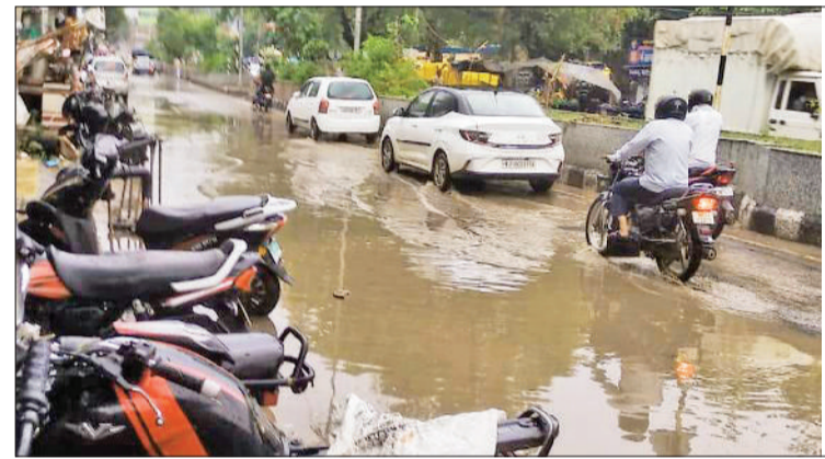
महेंद्रगढ़। आईटीआई मार्ग पर भरा बरसात का पानी।

ऐसी बरसात नहीं हुई थी। इस दौरान मौसम अधिकांशतया साफ-सुथरा रहा और जिन किसानों को बाजरे की लावणी समय पर नहीं कर पाने की चिंता सता रही थी, उनकी परेशानियां काफी हद तक दूर हो गई थी। उसके बाद से करीब डेढ़ महीना के अंतराल उपरांत आज सोमवार को ही मौसम ने पलटी खाई है तथा पहले रिमझिम एवं बाद में अच्छी बरसात हुई है। इस बरसात से मौसम ने भी कर्वट बदली है। पहले जहां दिन के समय तेज धूप खिलने से मौसम थोड़ी गर्मी को बना हुआ था, वहीं सोमवार को यही दोपहर का मौसम एकदम से बदल गया और इसमें ठंड घुल गई।