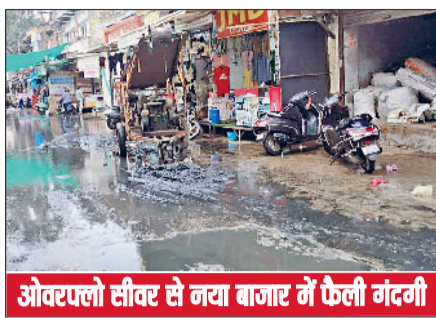
ओवरपलो सीवर से नया बाजार में फैली गंदगी