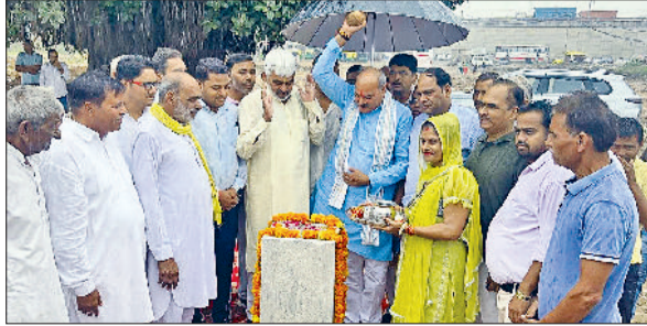
रेवाड़ी। धारुहेड़ा में बस स्टैंड के कार्य का शुभारंभ करते विधायक।

ने केंद्रीय मंत्री राव इंद्रजीत सिंह की मौजूदगी में किया था। बरसात का मौसम होने के कारण इसका निर्माण कार्य शुरू होने में कुछ विलंब हो गया।